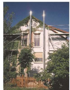
Außenwandkamine aus Edelstahl