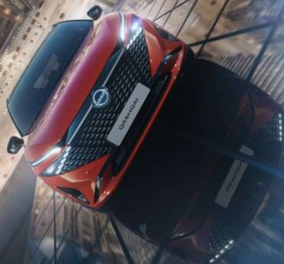
Abbildung zeigt: Nissan Qashqai 1.5 VC-T e-POWER 140 kW (190 PS), 4x2, Benziner: Energieverbrauch kombiniert: 5,1-5,3 (l/100 km); CO 2 -Emissionen kombiniert: 116-119 (g/km); CO 2 -Klasse: D