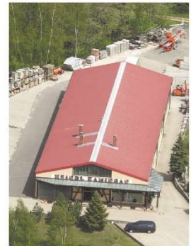
Betriebsstz Heindl Kamin

Ein Team von langjährig beschäftigten, hoch motivierten und geschulten Spezialfachleuten, ausgestattet mit modernstem Fuhrpark und Arbeitsgeräten, hat die Firma HEINDL KAMIN zu einem führenden, mehrfach ausgezeichneten Meisterbetrieb in Nordbayern wachsen lassen. Über 50 000 fachgerecht sanierte und neu erstellte Kamine sprechen für sich.