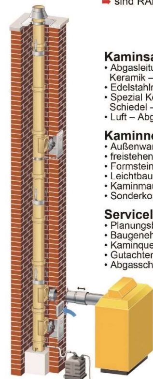
Systemaufbau High-Tech Keramikkamin

Wenn Sie wollen, dass Ihre Abgasanlagen planmäßig, optimal funktionieren und eine preiswerte, zuverlässige handwerkliche Ausführung vom Meister wünschen, dann werden Sie unser Kunde!